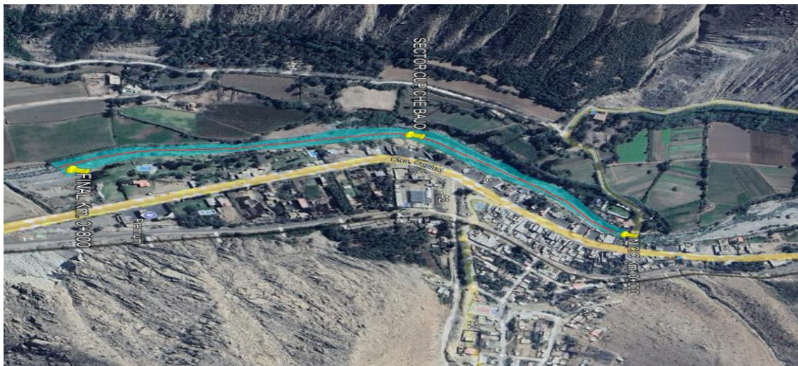
5.- IMAGEN SATELITAL DE ZONA VULNERABLE(GOOGLE EARTH)